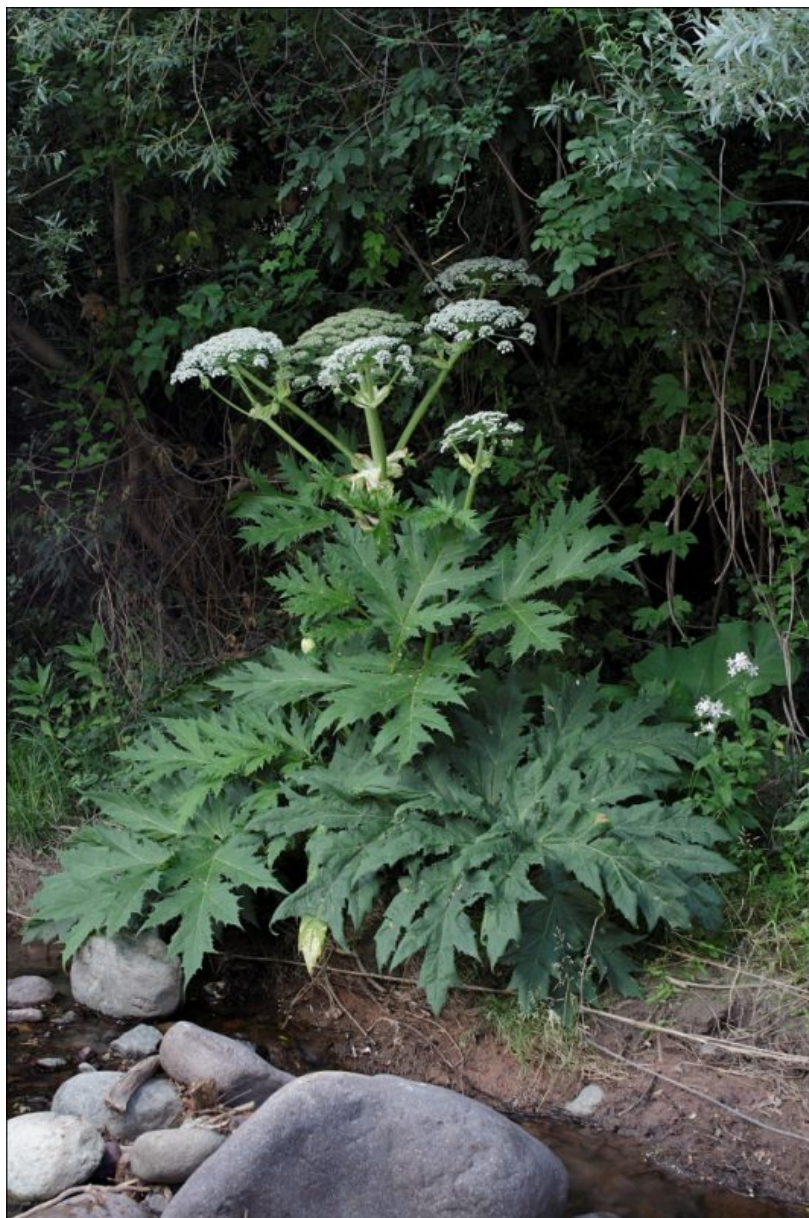
Karl Unterfrauner, Neophyten - Riesen Bärenklau , 2010. Fotografia a colori, 102 x 68 cm. Collezione Museion.

Unterfrauner realizza così un corpus di immagini che verranno poi esposte nel 2010 nell'ambito del progetto " Museion at the Eurac tower - Percorsi tra arte e scienza " organizzato in collaborazione tra Museion e Eurac. Grazie a questa collaborazione, due opere della serie Neophyten , ovvero Riesen Bärenklau (2010) e Götterbaum (2010), sono entrate a far parte della collezione di Museion .