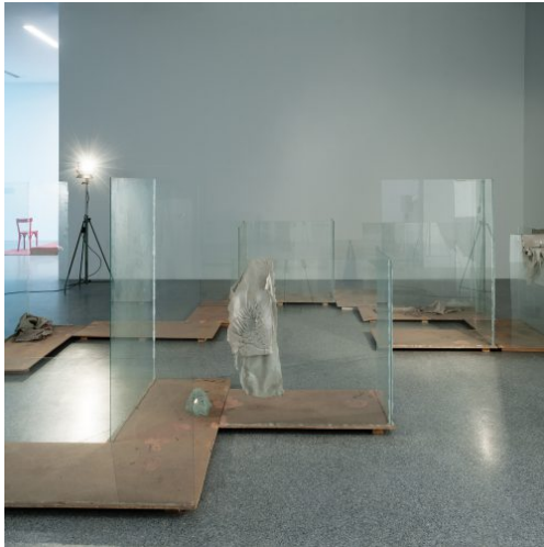
Migros Meets Museion. 20th Century Remix, installation view: Urs Fischer, Glaskatzensex – Transparent Tale, 2000. Sammlung Migros Museum für Gegenwartskunst