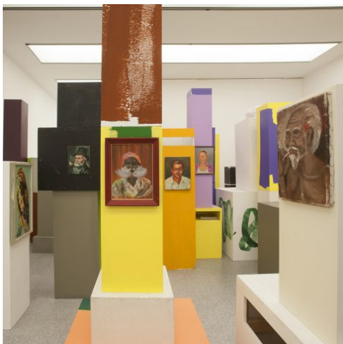
Migros Meets Museion. 20th Century Remix, installation view: Rachel Harrison, Trees for the Forest, 2007. Sammlung Migros Museum für Gegenwartskunst