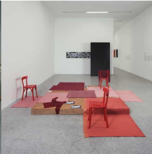
Migros 22w Migros Meets Museion. 20th Century Remix, installation view: Tom Burr, Susan Blushing, 2011. Museion – Sammlung / Collezione / Collection Enea Righi