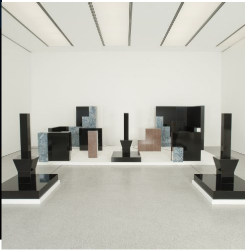
Migros Meets Museion. 20th Century Remix, installation view: Delia Gonzalez & Gavin Russom, No Way Back, 2006. Sammlung Migros Museum für Gegenwartskunst