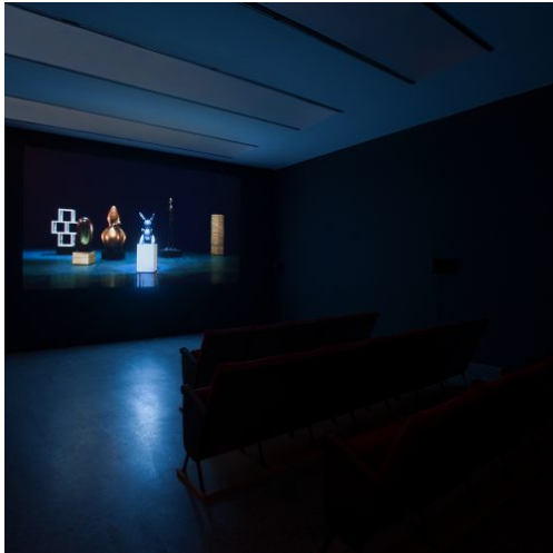
Migros Meets Museion. 20th Century Remix, installation view: Elmgreen&Dragset, Drama Queens, 2007. Sammlung Migros Museum für Gegenwartskunst Photo: Augustin Ochsenreiter

Collezione / Collection Enea Righi Photo: Augustin Ochsenreiter