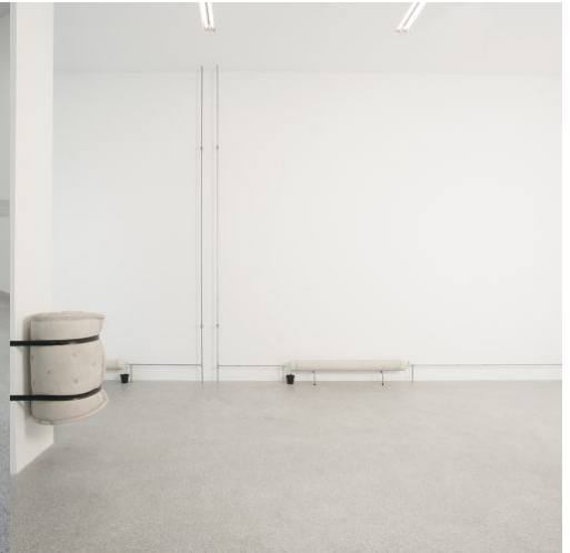
Migros Meets Museion. 20th Century Remix, installation view: Tatiana Trouvé, Inchoativity : The room is closing down, 2009. Sammlung Migros Museum für Gegenwartskunst