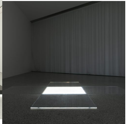
Migros Meets Museion. 20th Century Remix, installation view: David Lamelas, Límite de una proyección II (Limit of a Projection II), 1967. Museion - Sammlung / Collezione / Collection Enea Righi