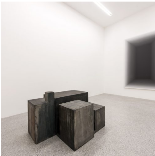
When Now is Minimal, exhibition view, Museion, 2013, Foto: Othmar Seehauser, Courtesy Sammlung Goetz, front: Peter Fischli & David Weiss, Fabrik, 1986