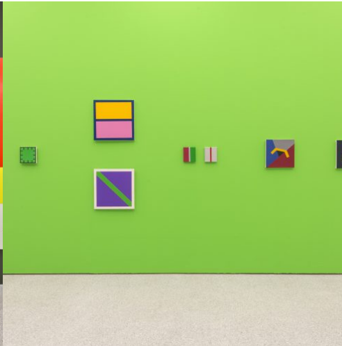
When Now is Minimal, Museion, exhibition view, 2013, Foto Othmar Seehauser, Courtesy Sammlung Goetz, front: Gerwald Rockenschau