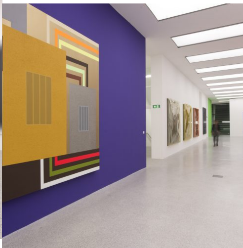
When Now is Minimal, Museion, exhibition view, 2013, Foto Othmar Seehauser, Courtesy Sammlung Goetz, front: Peter Halley, CUSeeMe, 1995