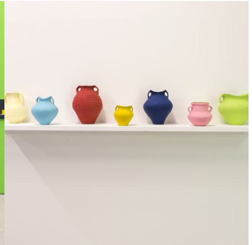
When Now is Minimal, Museion, exhibition view, 2013, Foto Othmar Seehauser, Courtesy Sammlung Goetz, front: Ai Weiwei, Colored, 2005