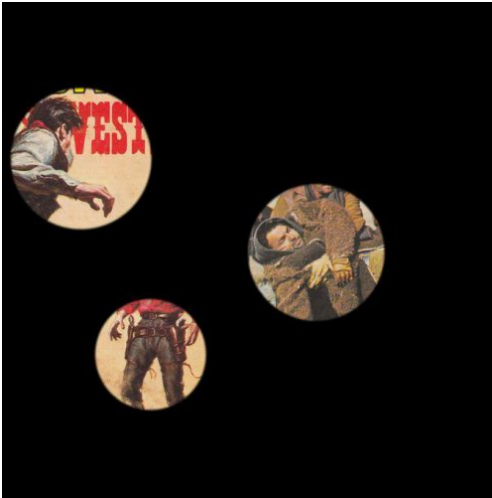
Opere – Sonia Leimer, Nur eine Handvoll Dreck!, 2012, Fondazione MUSEION. Museo d'arte moderna e contemporanea Bolzano.