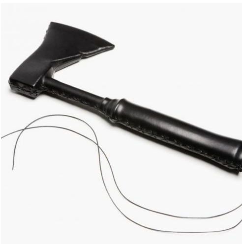
Opere – Monica Bonvicini Leather Tool (small straight ax), 2009, Collection Museion Foto: the artist, Courtesy Galerie Max Hetzler, Berlin