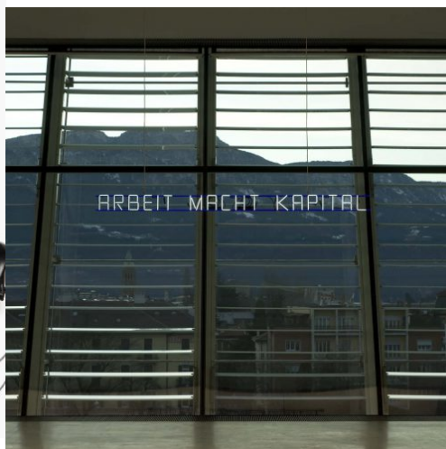
Opere – Claire Fontaine Arbeit Macht Kapital, 2004-12, Collection Fondazione Cassa di Risparmio di Bolzano