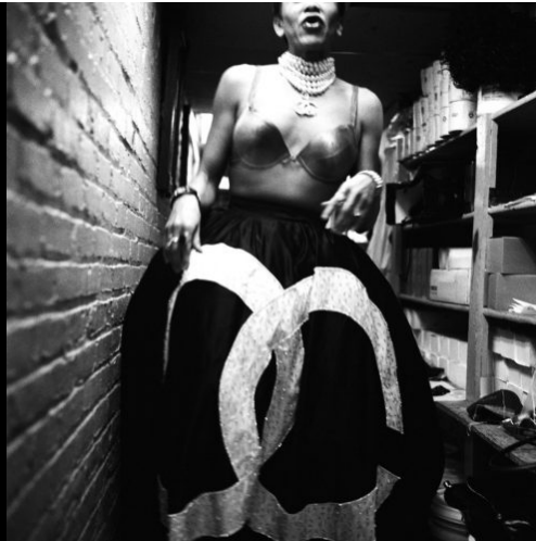
Opere – Vera Comploj, CChanel (In Between), Adams Morgan, 2009 Collezione Fondazione Cassa di Risparmio di Bolzano.