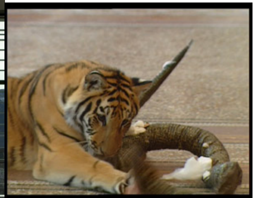
Opere – Peter Friedl, Tiger oder Löwe, 2000, Collection Enea Righi