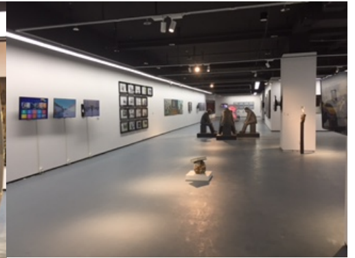
Installation view.