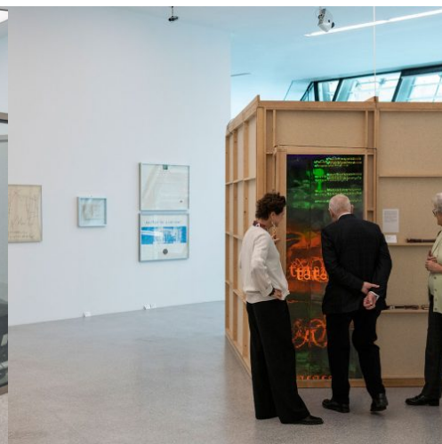
Dick Higgins, Poema d'aria/Luftsymphonie, 1973/1995, Museion – Collezione Archivio di Nuova Scrittura.