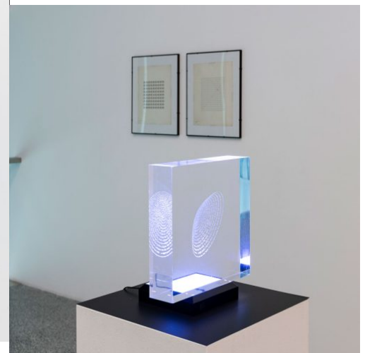
Alain Arias-Misson, The Push, 2016, Museion – Collezione Archivio di Nuova Scrittura. Foto Luca Meneghel