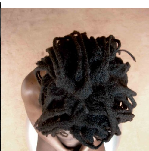
Zanele Muholi Self, 2005 Stampa alla gelatina d'argento in bianco e nero su carta fotosensibile (Ed. 4/8) 50,2 x 45 cm Collezione Museion