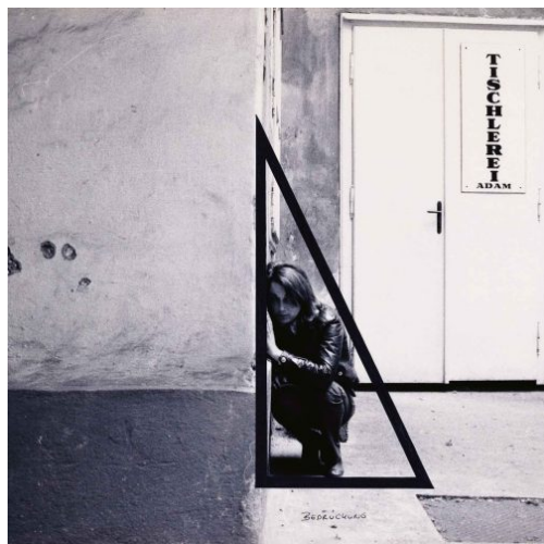
Valie Export Aufprägung, Körperkonfiguration, 1972 Collezione Museion