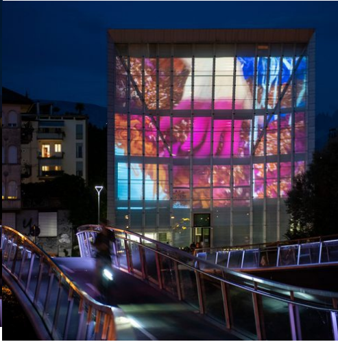
Museion, Facciata Mediale, Barbara Gamper, Becoming Otherwise (hot pink triangles and holes, or how to become woman?). Foto Luca Meneghel