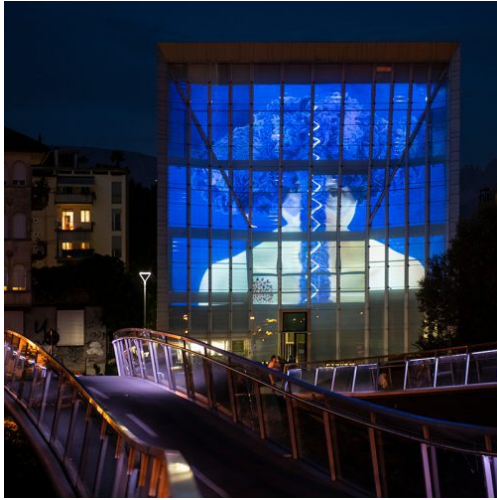
Museion, Facciata Mediale, Barbara Gamper, Becoming Otherwise (hot pink triangles and holes, or how to become woman?).