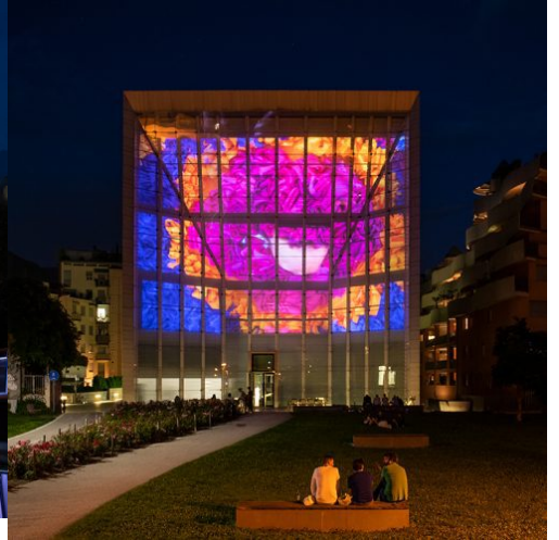
Museion, Facciata Mediale, Barbara Gamper, Becoming Otherwise (hot pink triangles and holes, or how to become woman?).