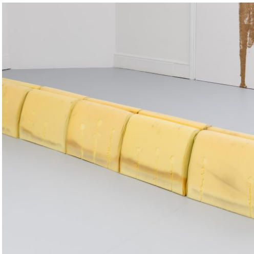
Ian Law, The wait is over. Exposed waiting room chair backs with picked home-dried flower shadows , 44 x 310 x 44 cm, 2015. Installation view, Ian Law: you're adjusting , Rodeo, London, 2015.

Il public program dedicato alla mostra includerà talk, incontri, proiezioni di film e una serie di eventi online e offline organizzati nell'ambito di Museion Art Club , con il supporto di Museion Private Founders .