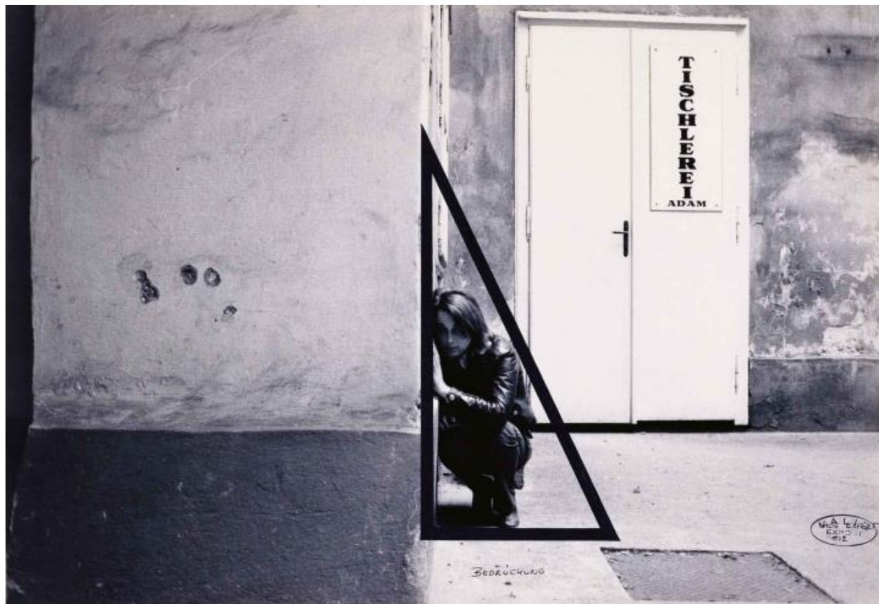
VALIE EXPORT; Bedrückung– Körperkonfiguration; 1972; Fotografie; Foto: Courtesy Klemens Gasser & Tanja Grunert, Inc. collezione Museion